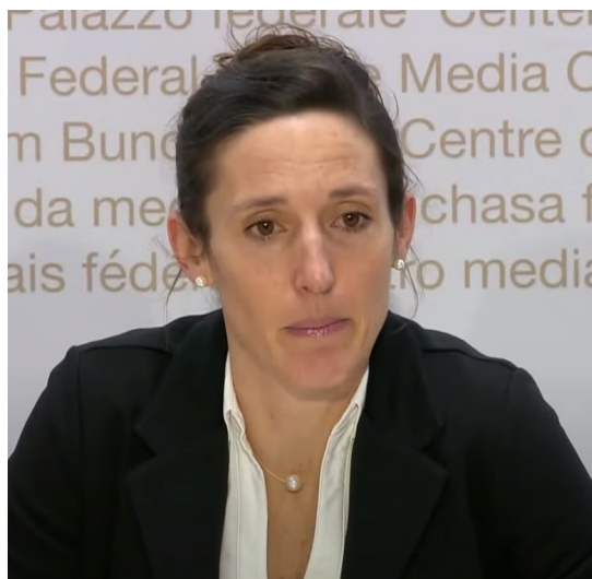
Tanja Stadler Présidente (depuis le 12.08.21)